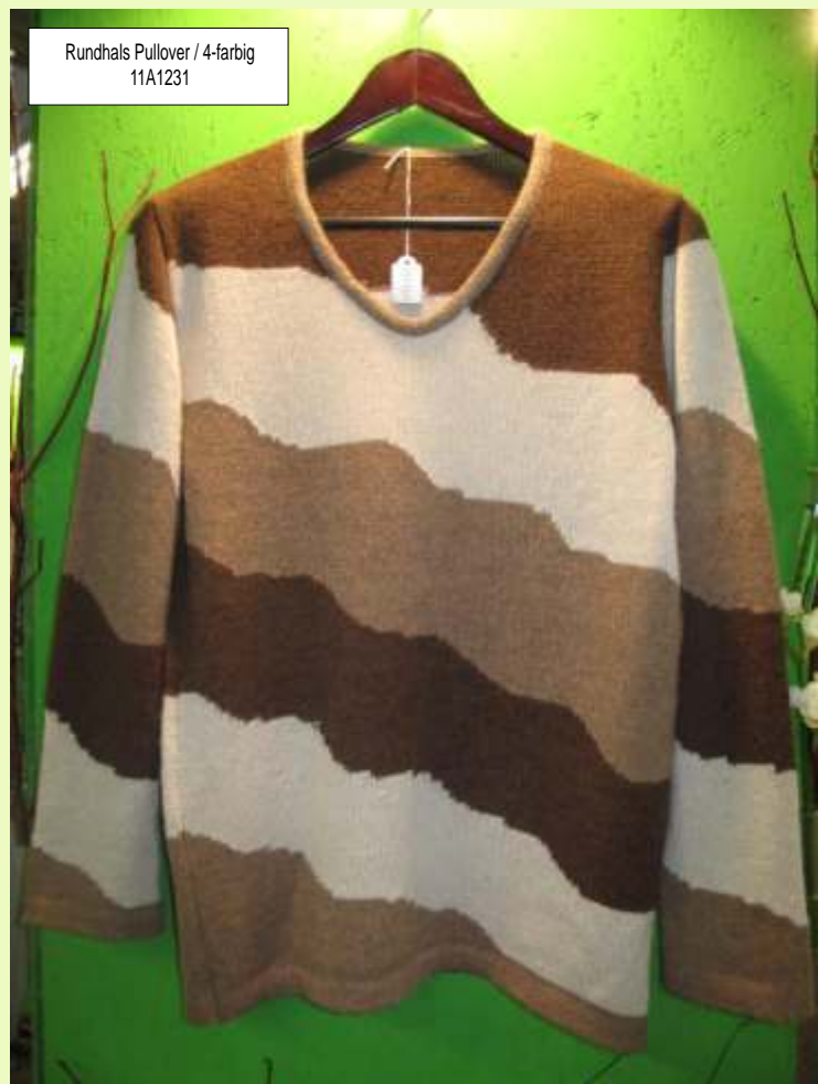
Rundhals Pullover / 4-farbig 11A1231