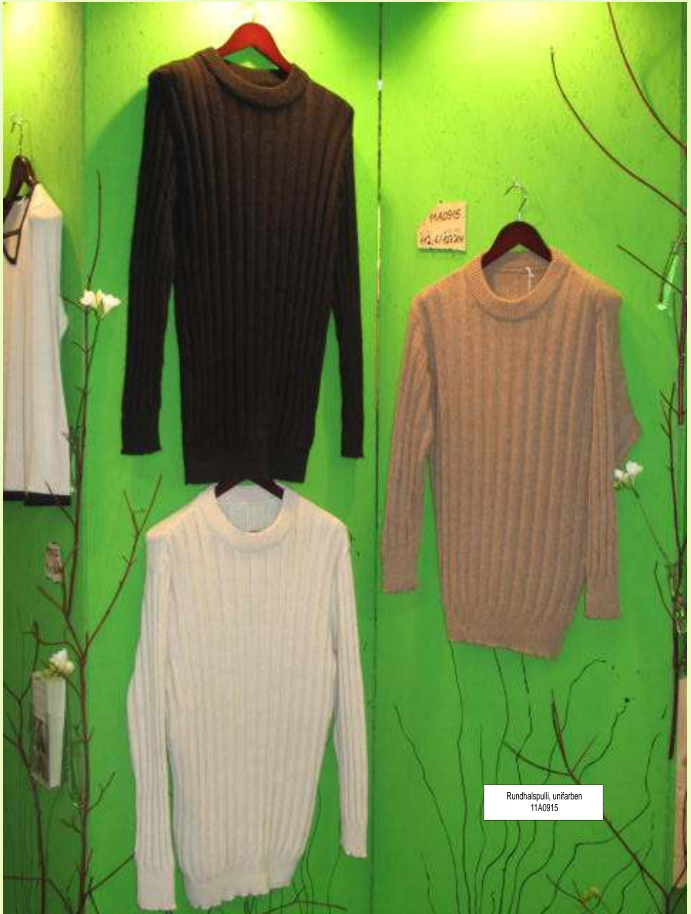
Rundhalspulli, unifarben 11A0915