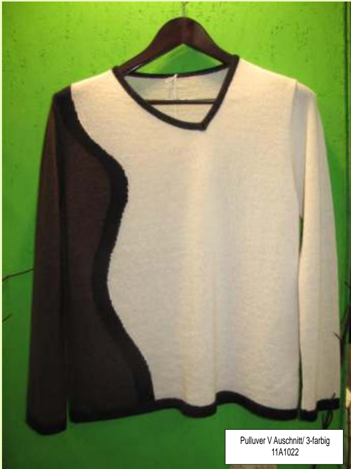
Pulluver V Ausschnitt/ 3-farbig 11A1022