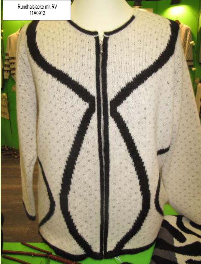
Rundhalsjacke mit RV 11A0912