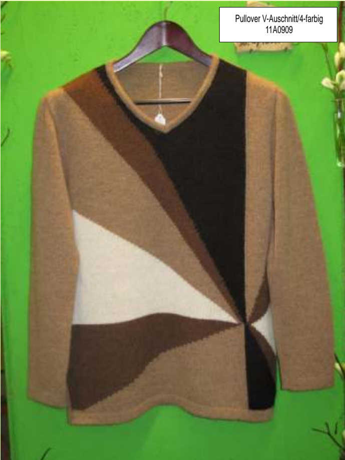
Pullover V-Auschnitt/4-farbig 11A0909