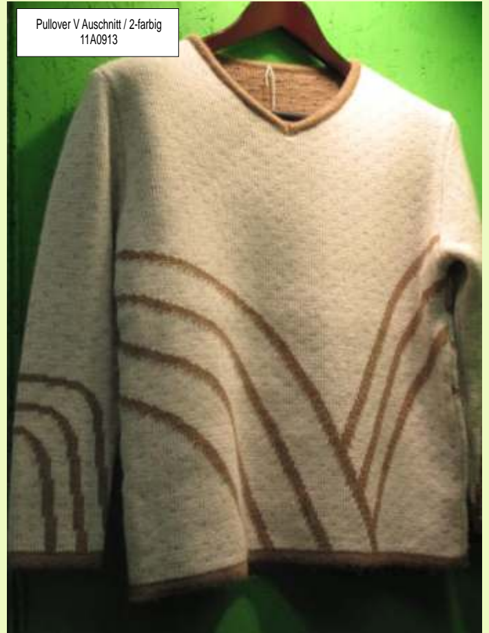
Pullover V Auschnitt / 2-farbig 11A0913