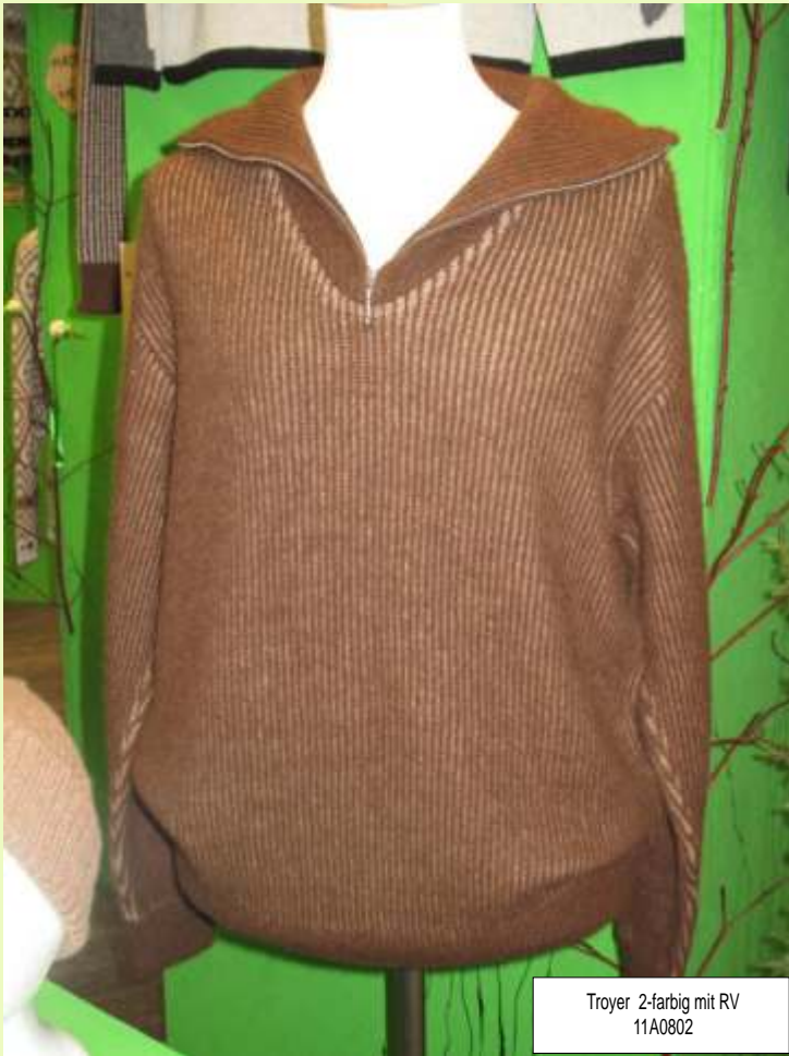
Troyer 2-farbig mit RV 11A0802