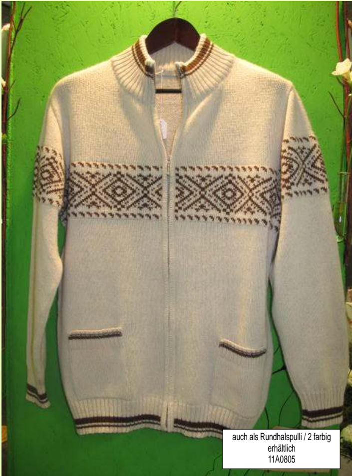
auch als Rundhalspulli / 2 farbig erhältlich 11A0805