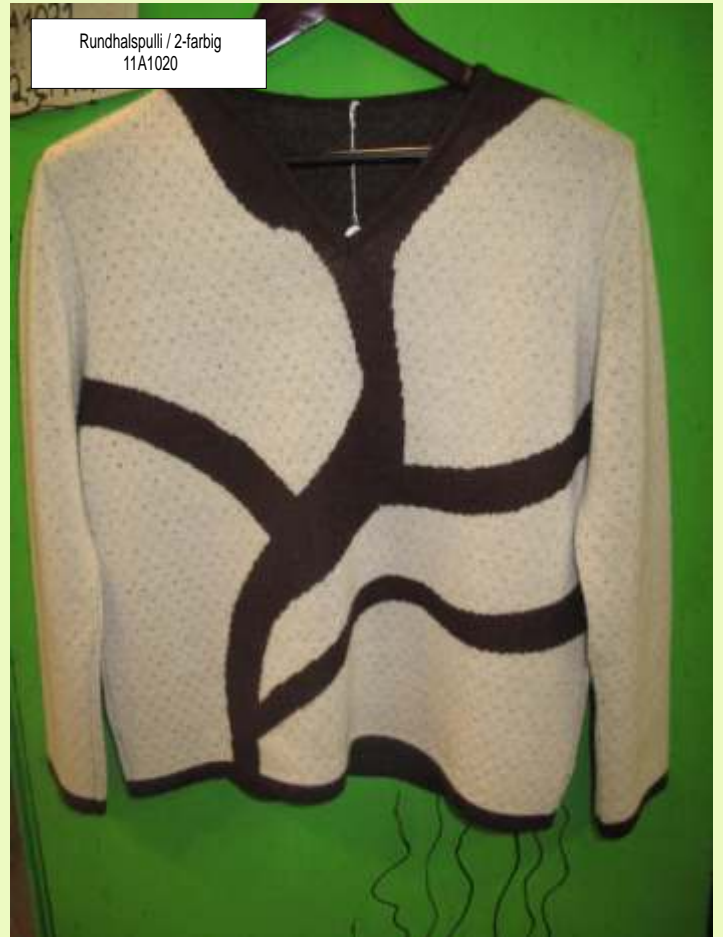
Rundhalspulli / 2-farbig 11A1020