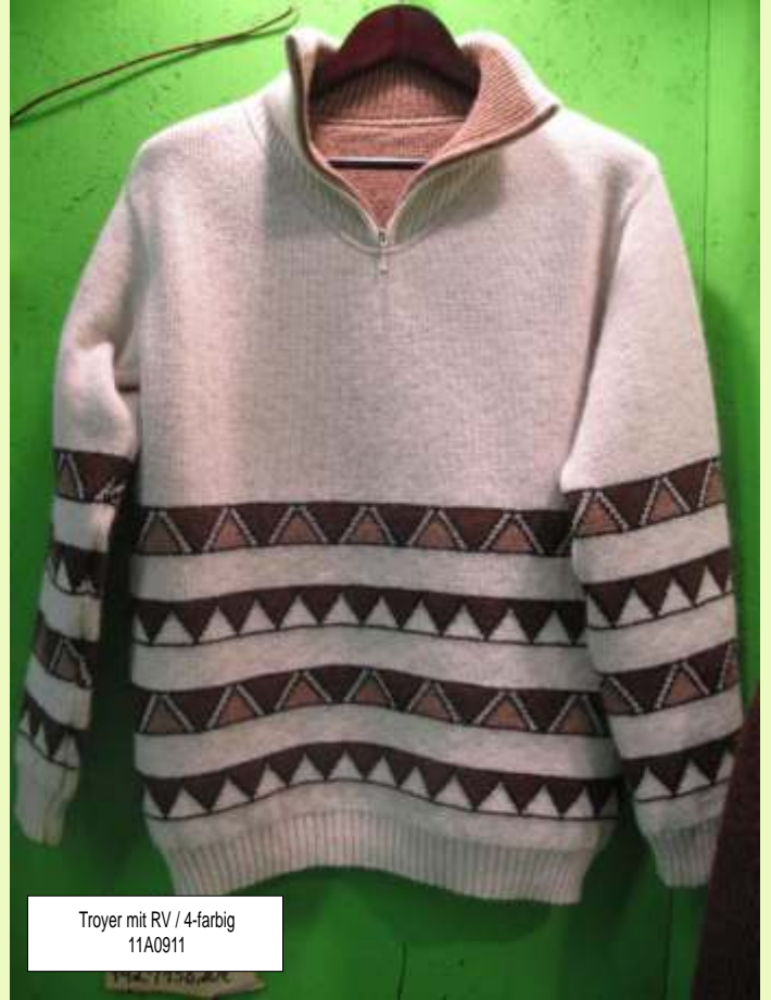
Troyer mit RV / 4-farbig 11A0911