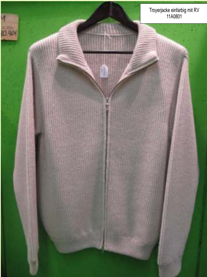
Troyerjacke einfarbig mit RV 11A0801