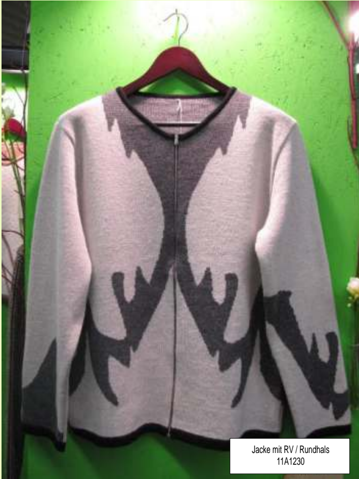
Jacke mit RV / Rundhals 11A1230