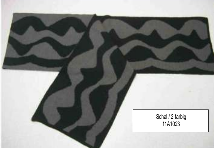
Schal / 2-farbig 11A1023