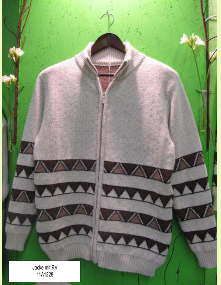
Jacke mit RV 11A1228