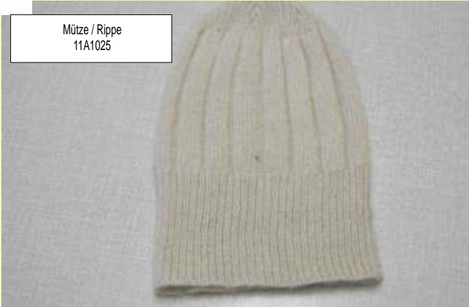
Mütze / Rippe 11A1025