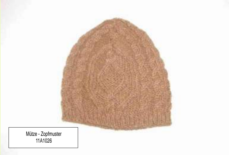
Mütze - Zopfmuster 11A1026