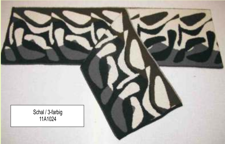
Schal / 3-farbig 11A1024