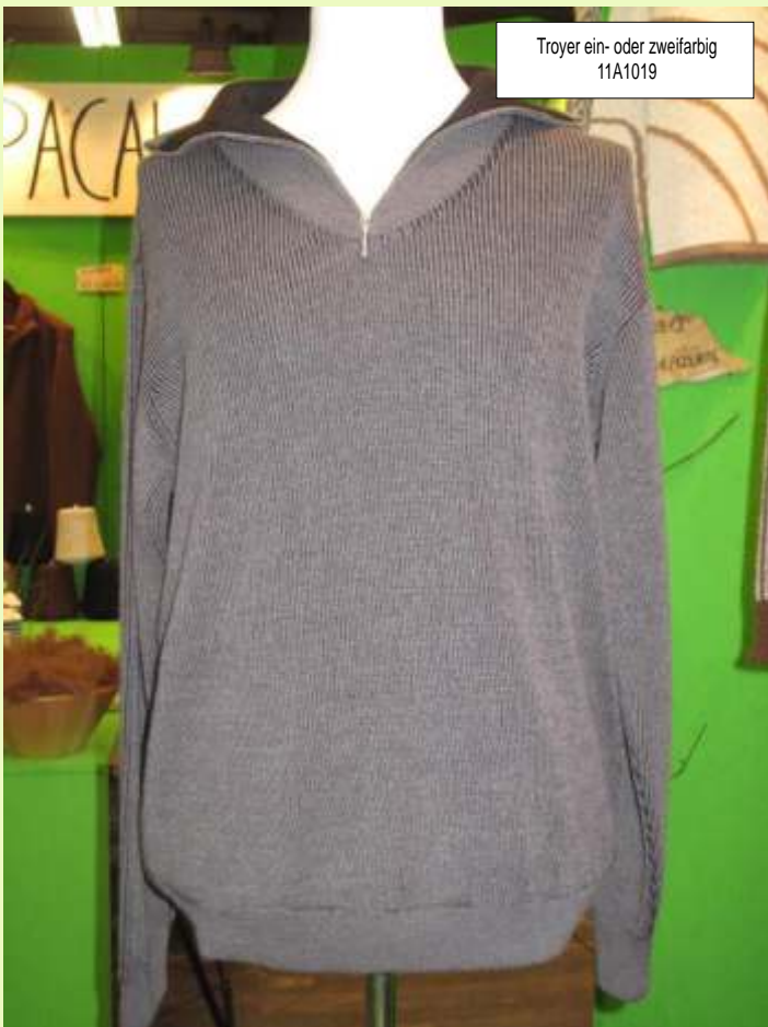
Troyer ein- oder zweifarbig 11A1019