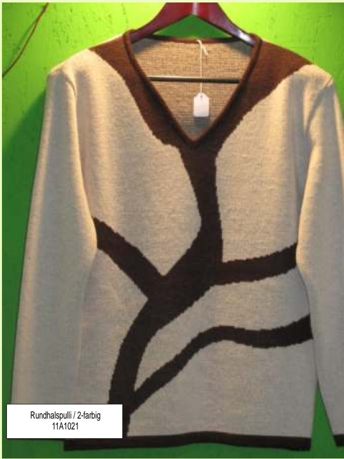
Rundhalspulli / 2-farbig 11A1021