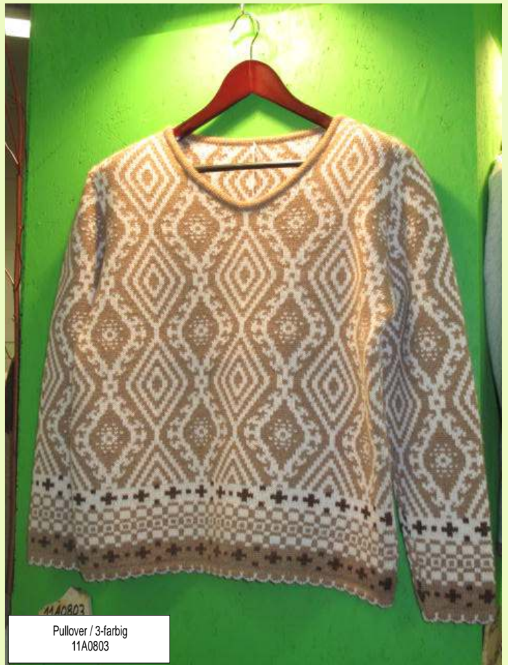
Pullover / 3-farbig 11A0803